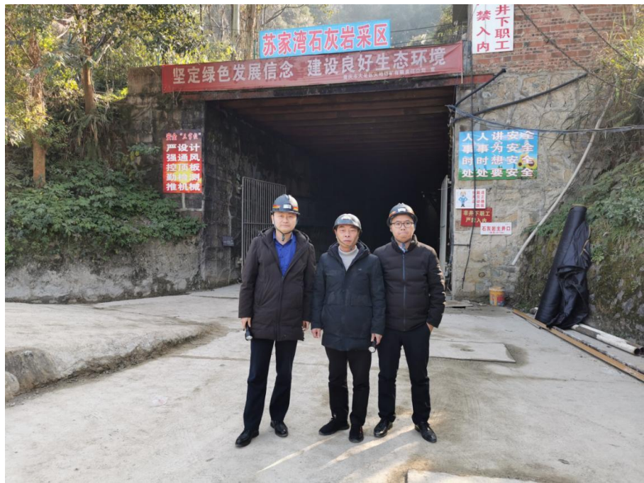
(附项目勘察相关图片)